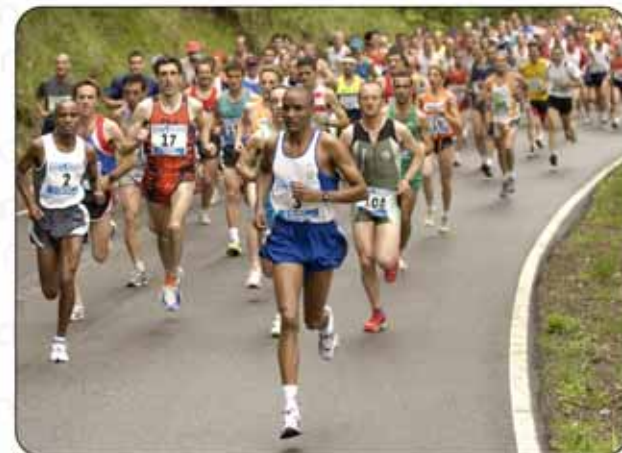
Vuelve el Medio Maratón de Benasque.